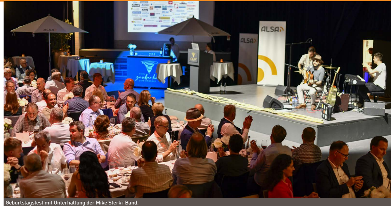
Geburtsstagsfest mit Unterhaltung der Mike Sterki-Band.