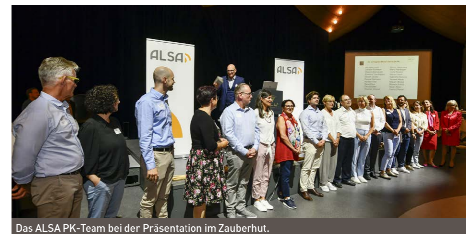
Das ALSA PK-Team bei der Präsentation im Zauberhut.