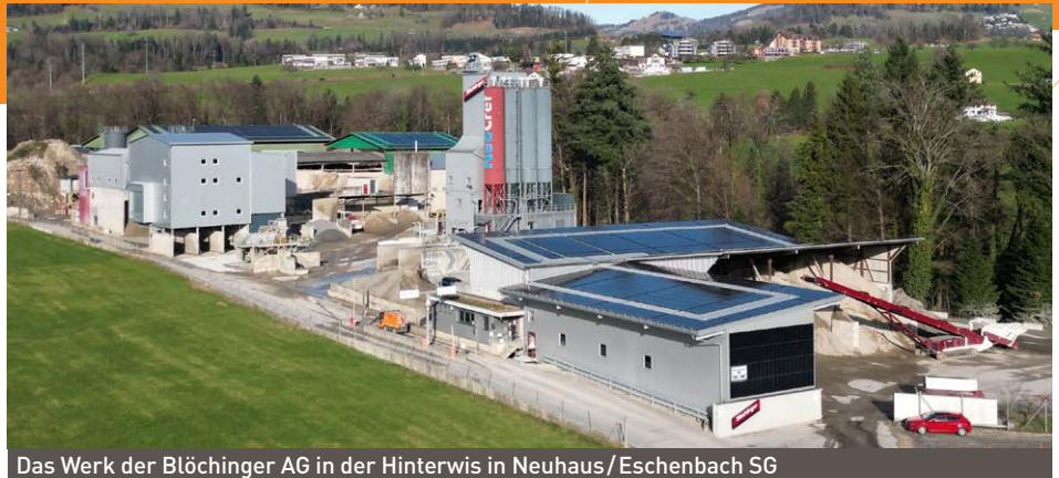
Das Werk der Blöchlinger AG in der Hinterwis in Neuhaus/Eschenbach SG